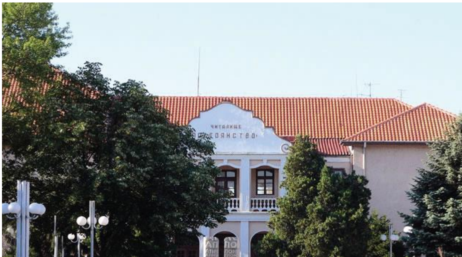
Читалище "Постоянство", гр. Лом - 1856 г.